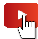
E-RAD BLU videó

Az E-RAD BLU termékcsalád precíziós nyomatékulcsai nagyfokú, +/- 2%-os ismételtetőségi fokot biztosítanak olyan alkalmazási területeken, amelyek nagy nyomatékot igényelnek, fejlett szerszámfunkciókkal és adatnaplózási lehetőséggel. Ez a korszerű elektronikus, pisztolymarkolattal ellátott nyomatékulcs a RAD kiforrott kialakítású áttételét az AC Servo motortechnológiával kombinálja, mellyel a csavarozási idő legalább 300%-kal csökkenthető a hagyományos hidraulikus nyomatékulcsokhoz képest. Nagy ciklusszámú és nagy teherbírású ipari felhasználásra, kültéren és beltéren egyaránt.