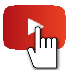
B-RAD OFFSET videó

A B-RAD SELECT most már beépített ofszet csatolóelemmel is elérhető, mely szűk helyeken történő csavarozáshoz ideális!